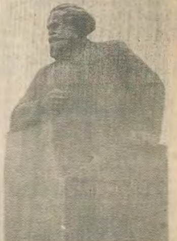
Μέχρι σήμερα οι φιλόσοφοι έχουν απλά ερμηνεύσει τον κόσμο κατά διάφορους τρόπους. Κείνο, όμως, που έχει σημασία, είναι να τον αλλάξουμε.

ΠΡΟΛΕΤΑΡΙΟΙ ΟΛΩΝ ΤΩΝ ΧΩΡΩΝ ΕΝΩΘΕΙΤΕ Καρλ Μαρξ